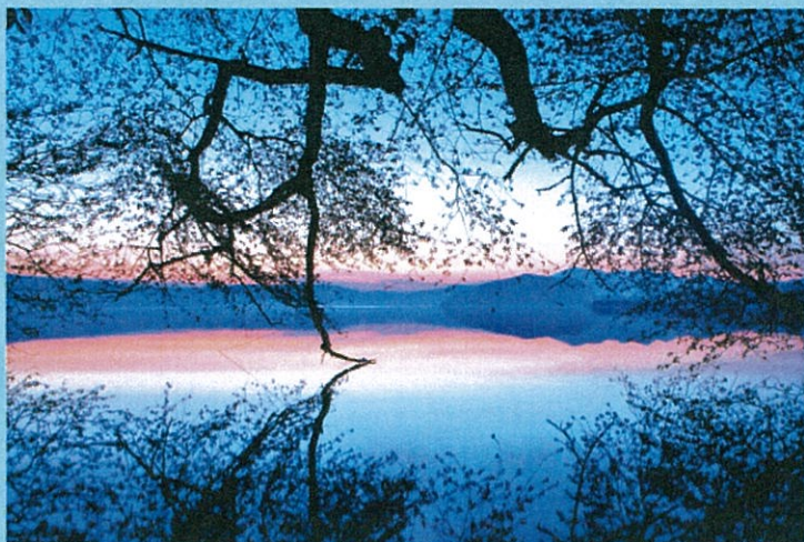
環境大臣賞作品 「ブルーの世界」 相内 悦子

〈問い合わせ〉十和田湖国立公園協会写真コンテスト係 TEL0176-75-2425 ホームページ http://www.towadako.or.jp/