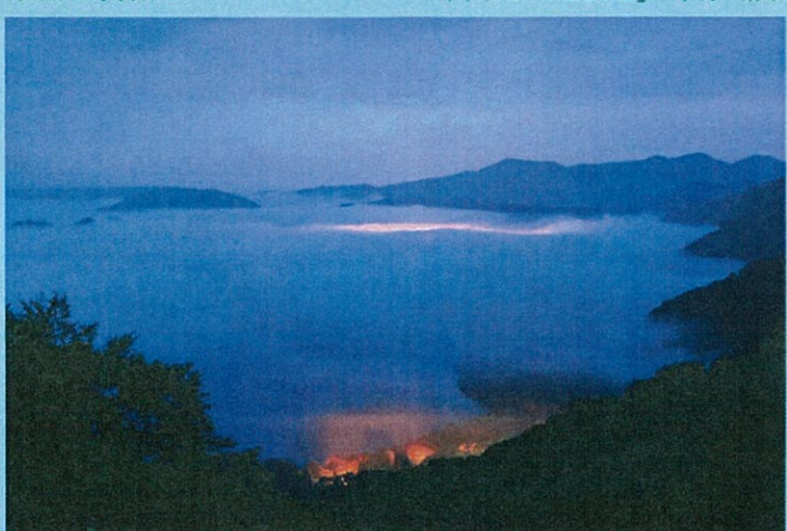
秋田県知事賞作品 「魅惑の光」 小笠原 孝