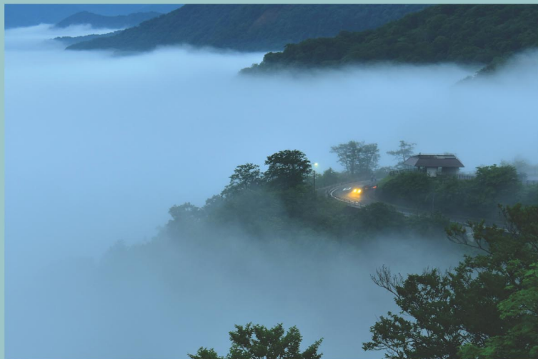
青森県知事賞作品 「十和田マチュピチュ」 木村 清栄