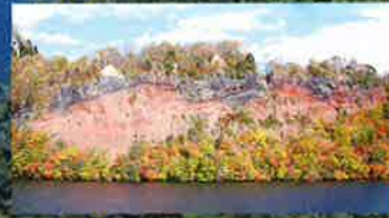
10 八之太郎の指袋を秘めた「五色岩」