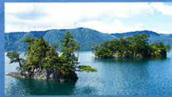
3 4 甲島・鎧島