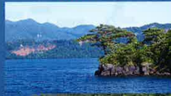
6 中山半島の先端にある「見返りの松」