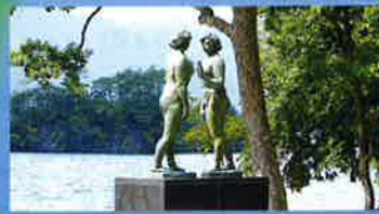
2 湖畔にたなずむ「乙女の像」

There is spectacular beauty that you can see only from the Excursion Boat.